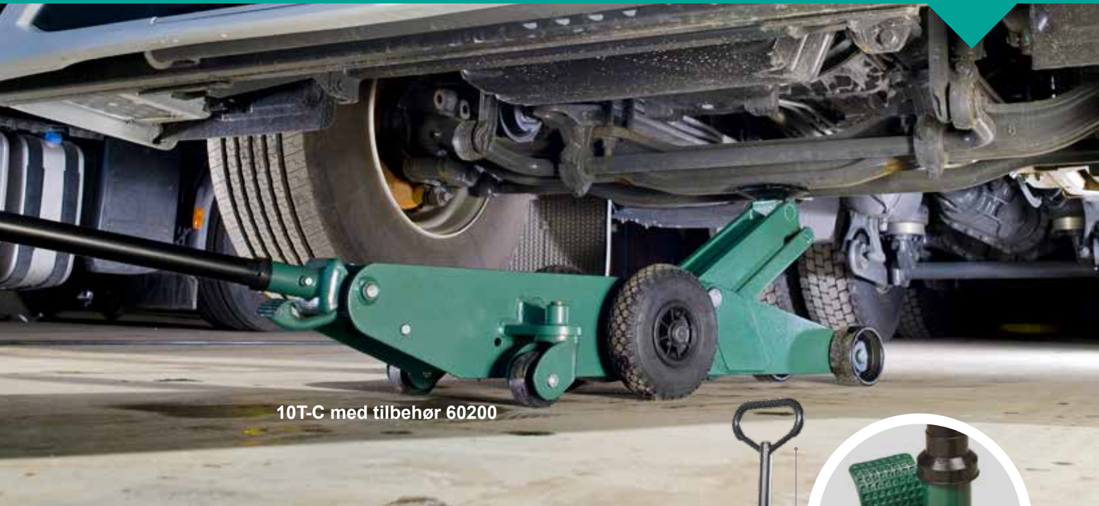
10T-C med tilbehør 60200

Lavt chassis med lang rækkevidde forbedrer adgang til løftepunkter dybt under lastbiler.