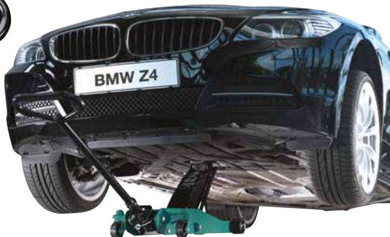
Lavt chassis med lang rækkevidde forbedrer adgang til løftepunkter dybt under køretøjer.