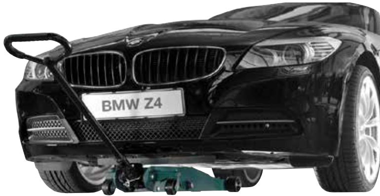
Ekstremt lavt chassis forbedrer adgang under lave køretøjer.