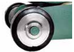
60245 Hårdgummi hjul. (Fabriksmonteret)