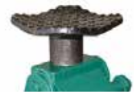
3068 Sattel til løft på løftepunkter placeret oppe bag skærter. (+ 40 mm)