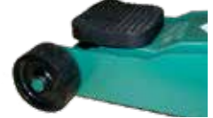
1077 Gummisaddel beskytter løftepunktet.