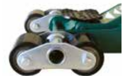
Bogie PU Bogie system med polyurthan ruller. (Fabriksmonteret)