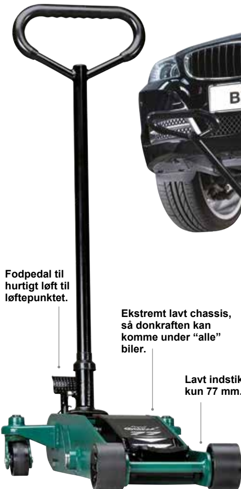
Fodpedal til hurtigt løft til løftepunktet.